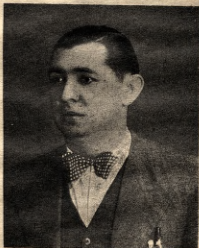
Secretario general de la Sociedad Artes Gráficas de S. Juan, de quien publicamos una colaboración en el número anterior.