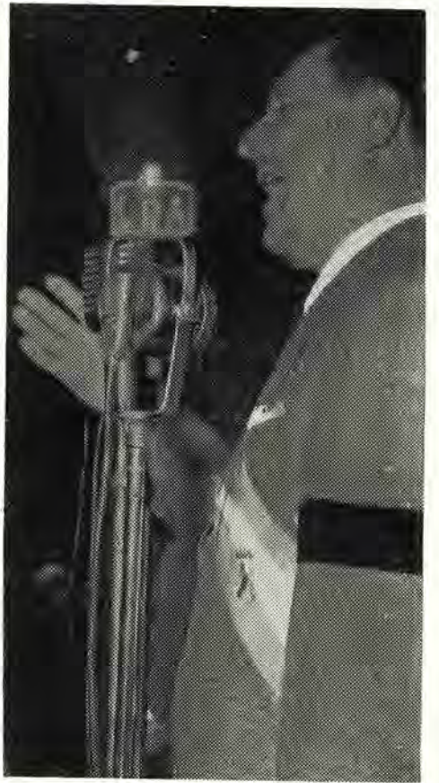
El Líder de los Trabajadores y Conductor de la Nueva Argentina habla a su pueblo

ductor de la Nueva Argentina que, gracias a su visión de gobernante, ocupa un lugar de privilegio entre todas las naciones del mundo, para orgullo de nuestro pueblo". Destacaba asimismo, el sentido del acto organizado por la C. G. T., "en celebración de un nuevo aniversario de la epopeya gloriosa en que el pueblo de la Patria, al impulso de sus más caros ideales de superación, libertó de las garras de la oligarquía al hombre que encarnaba las más altas virtudes ciudadanas, el entonces coronel Juan Perón, quien con su acción y su obra revolucionaria, había sentado las bases de la recuperación nacional con la sagrada consigna de luchar por una nación socialmente justa, económica-