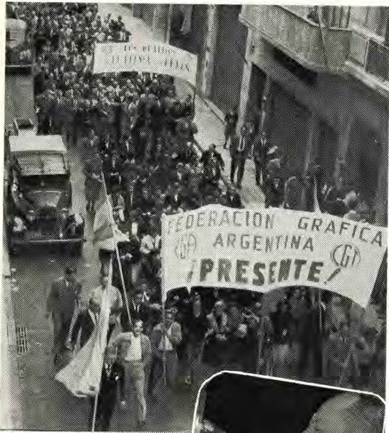
Jubilosamente avanza la columna de la Federación Gráfica hacia la magna concentración