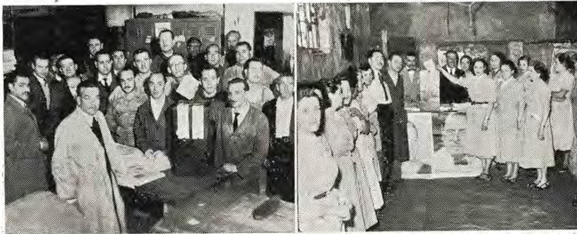
JORNADAS COMICIALES. — Aspectos de los comicios realizados en "The Standard" y "L. J. Rosso" para elegir sus respectivas comisiones internas y que fueron ejemplares jornadas de compañerismo

"Queremos destacar especialmente, que los servicios incorporados se efectuarán sin cargo para los beneficiarios incluidos en el régimen asistencial vigente."