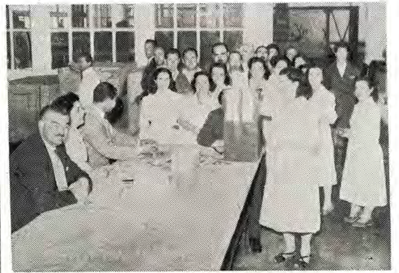
Con auténtico sentido de disciplina y alto espíritu de compañerismo votan las compañeras y compañeros del Establecimiento "Kraft"