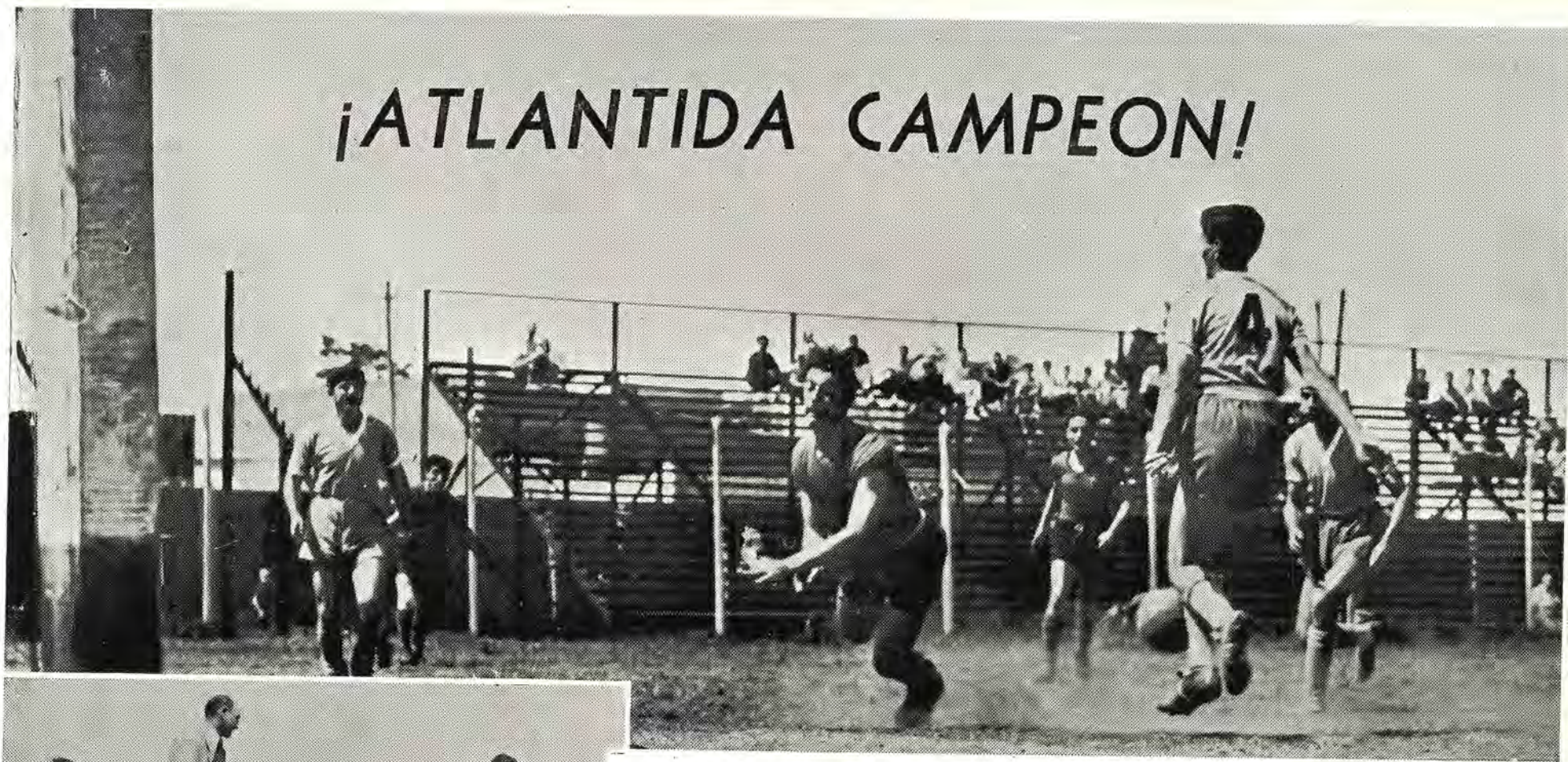
Enérgicas acciones caracterizaron la última jornada del campeonato de fútbol organizado por la Federación Gráfica Argentina y del cual se clasificó vencedor el equipo de Atlántida