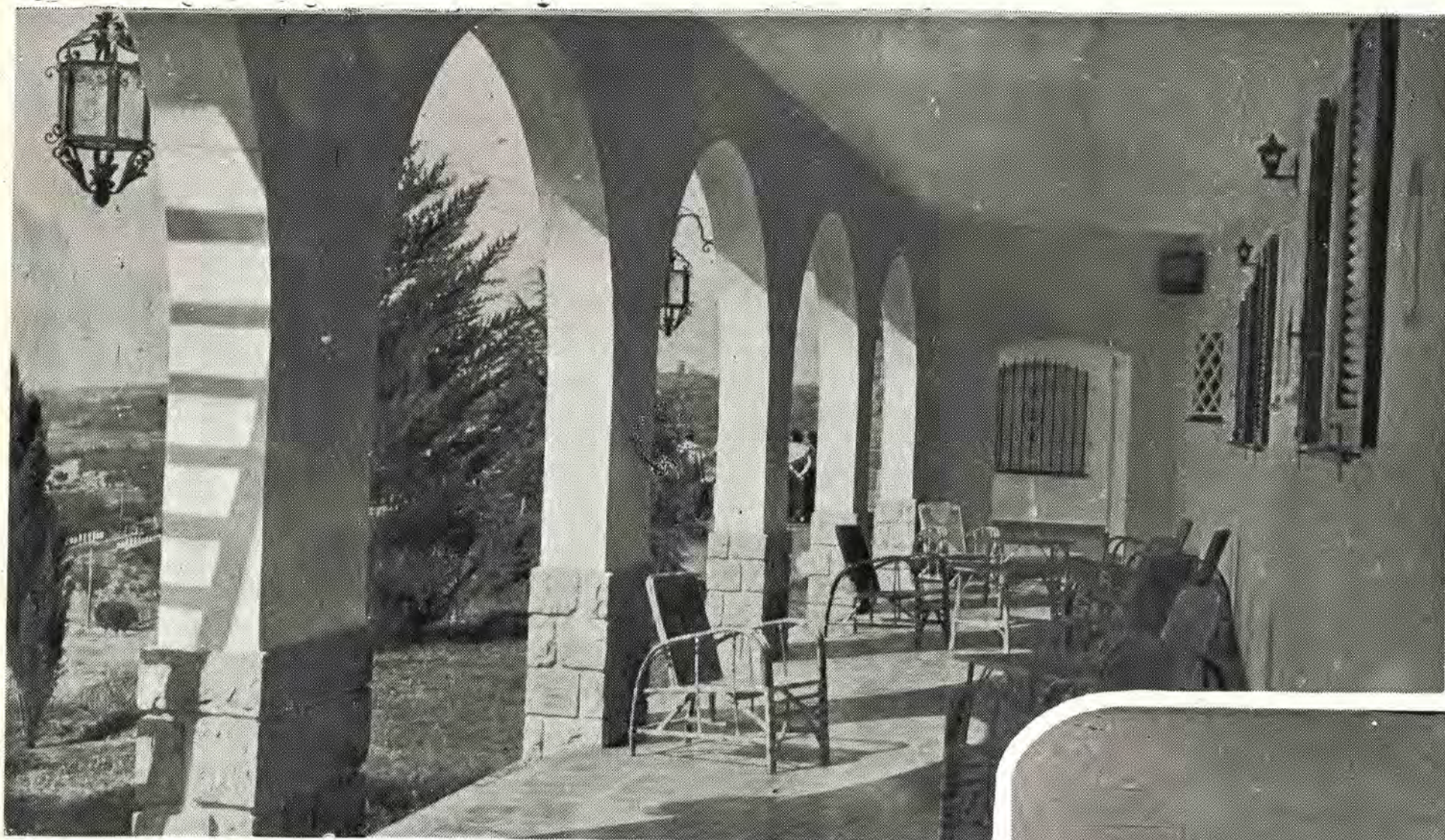
Una de las hermosas y soleadas galerías frontales del hotel, propicias al reposo y a la tertulia íntima, en un ambiente de gratas características