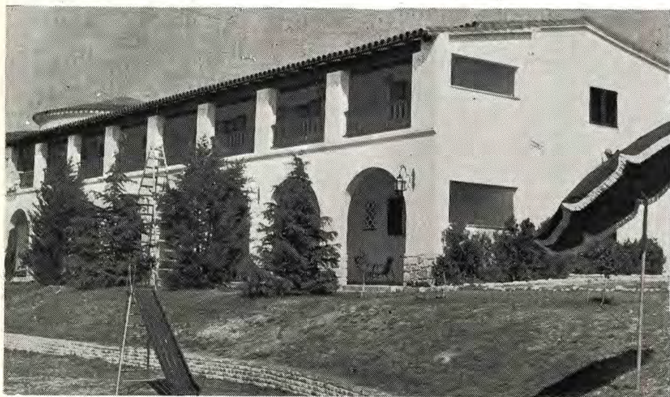
Imponente y espléndido en la severidad de su línea arquitectónica se alza sobre el paisaje serrano el hotel de la Colonia de Vacaciones de los compañeros gráficos