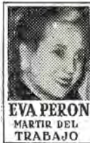
EVA PERON MARTIR DEL TRABAJO