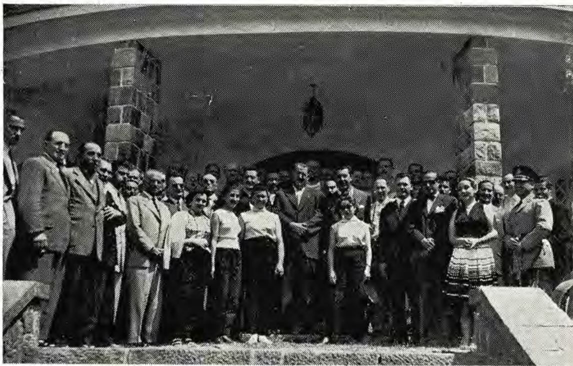
El gobernador de Córdoba, miembros del Consejo Directivo de la F. G. A. e invitados especiales, en un momento de la grata fiesta a que dió lugar la inauguración de la Colonia

Aproximadamente al medio día, los invitados fueron agasajados con un vino de honor, que se sirvió en el gran salón comedor del hotel, brindándose entonces por el general Perón, cuya obra y cuyas magníficas enseñanzas posibilitan estas realizaciones. Después todos los con-