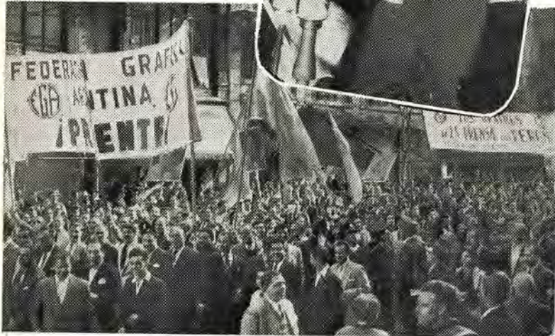
Los trabajadores gráficos, con cartelones y banderas, sumaron su entusiasmo y su fervor peronista a la extraordinaria concentración convocada por la central obrera en Plaza de Mayo