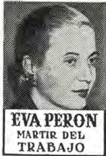
EVA PERON MARTIR DEL TRABAJO