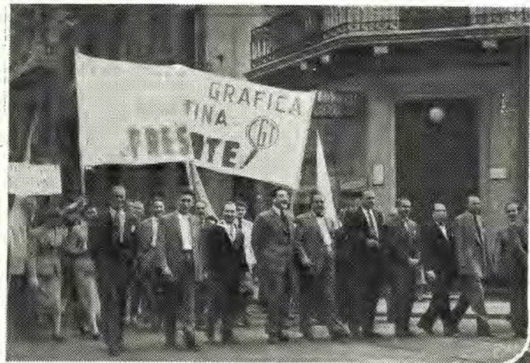
El Consejo Directivo de la F. G. A. encabeza la densa columna de los trabajadores gráficos en la celebración del Día de la Lealtad