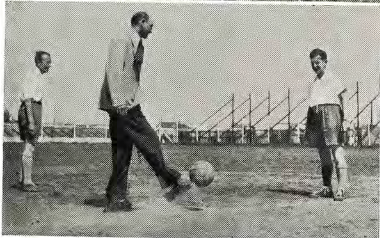
El compañero Tuja señalando el comienzo del bravo encuentro

La Copa Presidente Perón, así como las medallas, serán entregadas en un acto público que realizará la F. G. A. y al cual concurrirán todos los equipos que actuaron en el torneo.