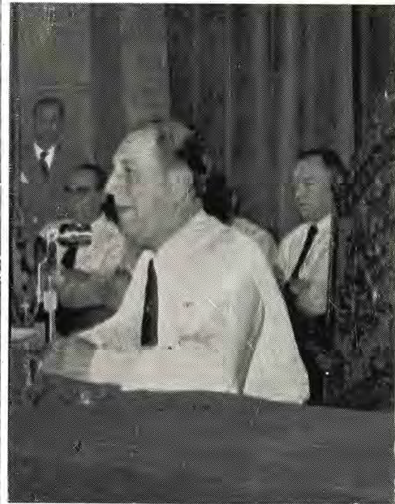
HABLA EL CONDUCTOR. — El general Perón pronunciando el magistral discurso en el cual señaló la misión de las organizaciones sindicales y la responsabilidad de los dirigentes obreros

CON motivo de la celebración del décimo aniversario de la Secretaría de Trabajo y Previsión, que señala el comienzo de la defensa auténtica e insobornable de los intereses de la clase trabajadora, la Federación Gráfica Argentina adhirió a los paros dispuestos por la C. G. T. y concurrió en nutrida manifestación a la asamblea obrera del Luna Park, donde se ratificó la lealtad al general Perón.