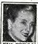
EVA PERON MARTIR DEL TRABAJO