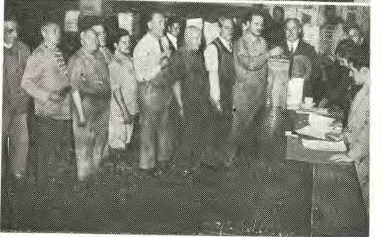
ELECCIONES. — Los compañeros de "N. I. S. S. A." y "La Nación", durante los actos eleccionarios en que designaron sus respectivas comisiones internas, dentro de un clima de compañerismo y disciplina