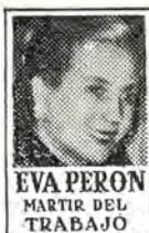
EVA PERÓN MARTIR DEL TRABAJO