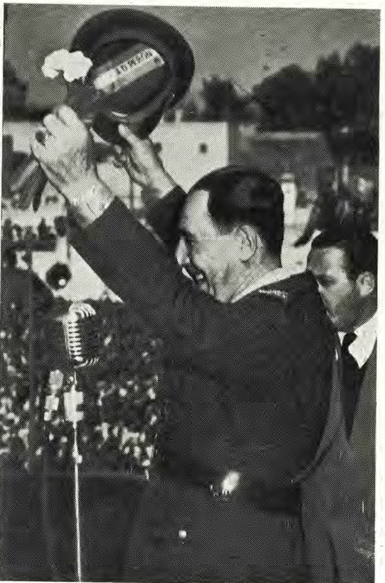
SALUDA AL PUEBLO. — Un momento emocionante en la visita del general Perón a Santiago del Estero; cuando desde la sede de la C. G. T. saluda a la multitud de trabajadores y al pueblo en general, que vitorea clamorosamente el nombre del Conductor