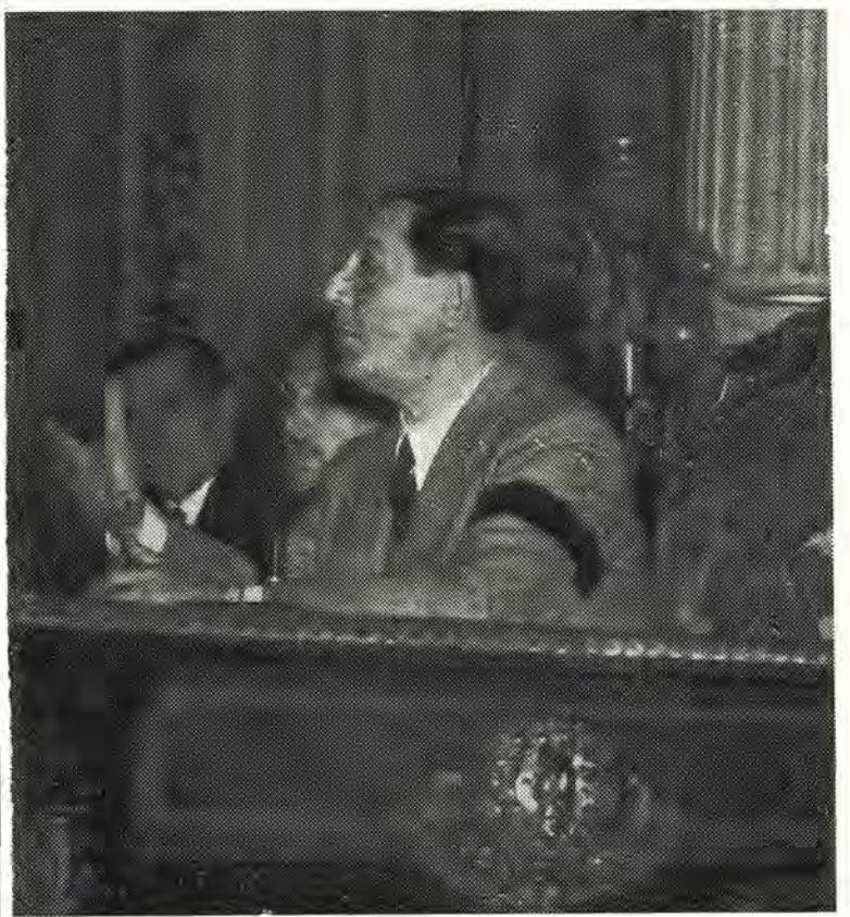
HABLA EL CONDUCTOR. — El general Perón, pronunciando su magistral clase de sindicalismo durante la reunión con los secretarios de gremios y gestores de previsión social, realizada en la Casa de Gobierno

Agregó después: "Lo primero que hay que hacer es estudiar e ir imponiendo, a través de los hechos mismos, la significación de todo el diligenciamiento, que creo ahora es muy complicado. La forma de obtener la documentación; la forma de presentar cada hecho, debe ser de lo más sencillo para que llene lo fun-