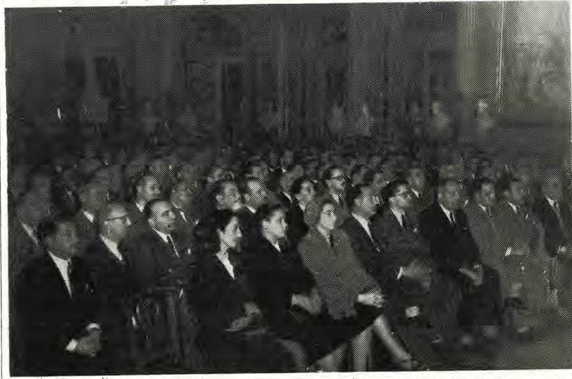
SECRETARIOS Y GESTORES.—Los secretarios de gremios y gestores de previsión social, escuchan con viva atención los aleccionadores conceptos del Gral. Perón, quien indicó, con la claridad medular de sus expresiones, la función que corresponde a los sindicatos en la defensa de los auténticos derechos del trabajador

"Yo deseo, y pido a Dios, que lleven ustedes en esa conducta el acierto y también el buen nombre, a través de los cuales uno ennoblece las cosas o envilece la vida. En eso, compañeros, está el éxito que yo les deseo de todo corazón a cada uno de ustedes y a las organizaciones en general.