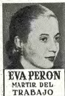
EVA PERON MARTIR DEL TRABAJO

Al término del discurso del compañero Vuletich, que fué seguido con gran interés, la concurrencia cantó la marcha de "Los Muchachos Peronistas", renovándose las cálidas manifestaciones de adhesión al general Perón y a su grandiosa obra de gobierno, así como al Segundo Plan Quinquenal y a la Doctrina Justicialista, que inspira la creación de la Escuela Sindical.