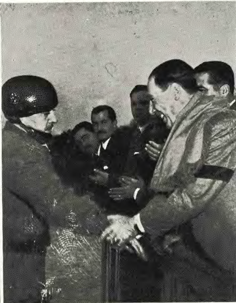
SALUDO PRESIDENCIAL. — El primer mandatario de la República, general Perón, saluda a uno de los paracaidistas que participaron en las magnificas maniobras militares realizadas en Córdoba y a cuyo aspecto decisivo asistió el Conductor de la Argentina Justicialista

"Antes de afirmar la unidad nacional en los mapas — dijo también — debemos afirmarla en el corazón de cada uno de los argentinos. Por eso, cuando nosotros hemos entregado a los dirigentes argentinos la responsabilidad de una tarea tan trascendente y fundamental, lo hemos hecho confiando en el gran corazón que nuestros dirigentes tienen." "Trabajar por la solidaridad gremial es hacer permanentemente la organización sindical argentina."