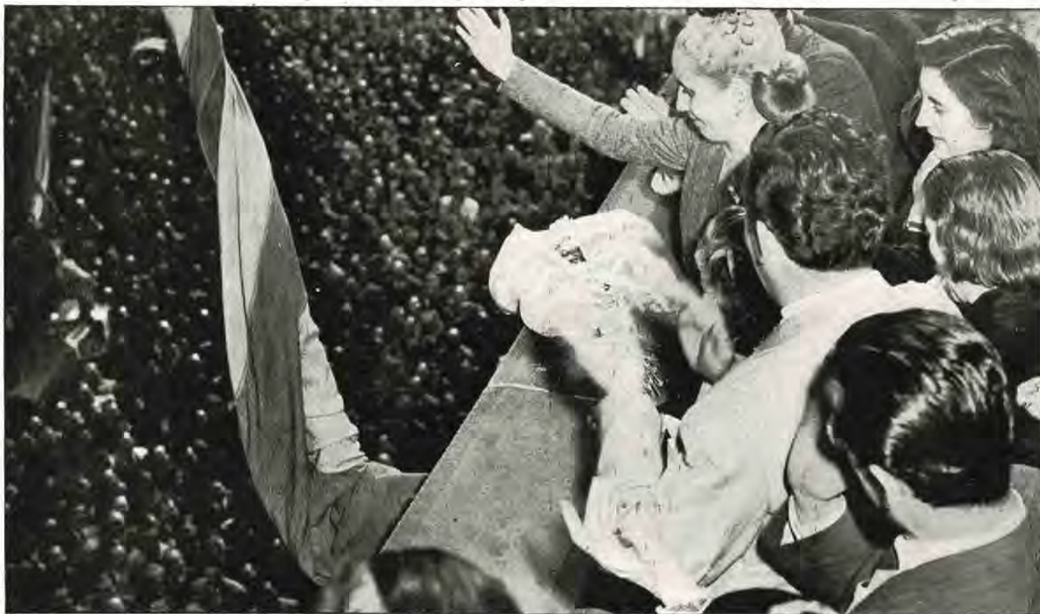
La señora Eva Perón saluda desde uno de los balcones del Ministerio de Trabajo y Previsión a la multitud de trabajadores de la imprenta que acudieron a expresarle su adhesión, poco después de finalizada la asamblea en que fueron dados a conocer los términos del Convenio

Art. 22. — Adicional por mayor responsabilidad: El obrero gráfico que en forma, accidental o no, sea directamente responsable del trabajo de otro u otros, de categoría igual o superior, deberá percibir un aumento mínimo del 10 % sobre el salario que normalmente corresponda a su categoría. Cesa esta remuneración cuando éste vuelve a sus tareas normales.