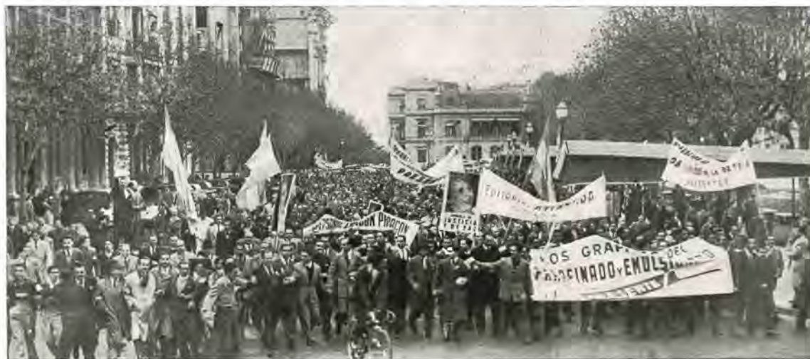
Cabeza de la columna de manifestantes, todos obreros gráficos, encaminándose desde el Luna Park hasta el Ministerio de Trabajo y Previsión. Portando carteles alusivos y grandes fotografías de la señora de Perón, los trabajadores de la imprenta pasan por la Plaza de Mayo en el más completo orden, pero animados de desbordante júbilo.

mos logrado llene ampliamente su cometido.