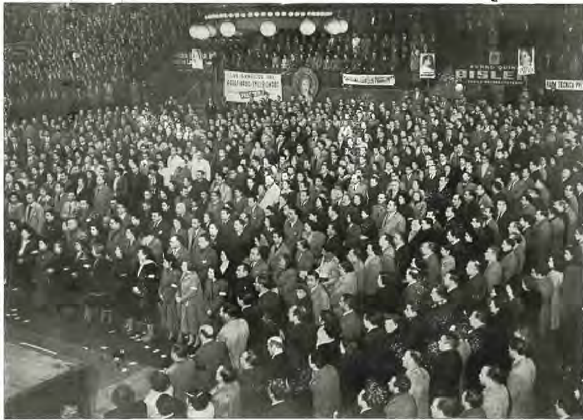
Cuando, al iniciarse la magna asamblea del Luna Park fué ejecutado el Himno Nacional, la concurrencia púsose de pie, respondiendo a un solo impulso: el de su acendrado fervor patriótico. Las estrofas de nuestra sublime canción fueron entonadas con verdadero entusiasmo, y sus últimas notas rubricadas con un clamoroso aplauso. Fué un instante gratisimo para la concurrencia, que tuvo oportunidad de exteriorizar su profundo sentido de nacionalidad.

Todo obrero que reemplace eficientemente a otro de categoría superior, percibirá el sueldo correspondiente a la categoría que pase a ocupar, desde el primer día inclusive, cuando el reemplazo sea por más de tres días. Cesa esta remuneración cuando el titular se reintegre a su puesto y el reemplazante pase a ocupar el suyo anterior.