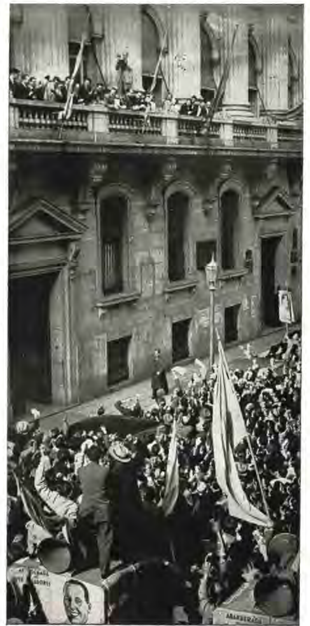
Otro aspecto de la concurrencia congregada frente a los balcones del Ministerio de Trabajo y Previsión, durante la manifestación realizada por los obreros gráficos para agradecer a la señora Eva Perón la aprobación del Convenio Justicialista.