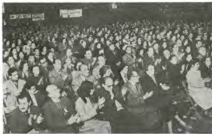
Otro aspecto de la asamblea realizada en el Luna Park: La instantánea fué tomada en momentos en que el público celebra con grandes aplausos el anuncio de las diversas e importantes mejoras.