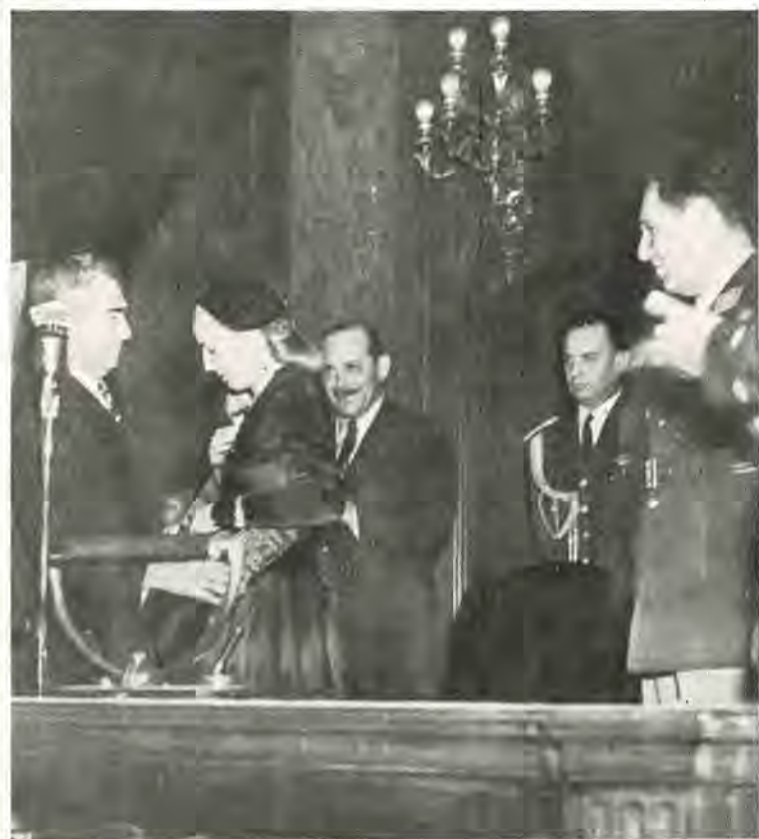
MERECIDO PREMIO. — Eva Perón, nuestra compañera Evita, recibe la Gran Cruz del Sol, impuesta por el gobierno del Perú, como testimonio de reconocimiento hacia la noble y generosa obra que viene cumpliendo la Primera Dama Argentina en beneficio de los necesitados, no sólo de nuestro país, sino del Continente.

AÑO XLI — Buenos Aires, Agosto de 1950 — N° 385 "Año del Libertador General San Martín"