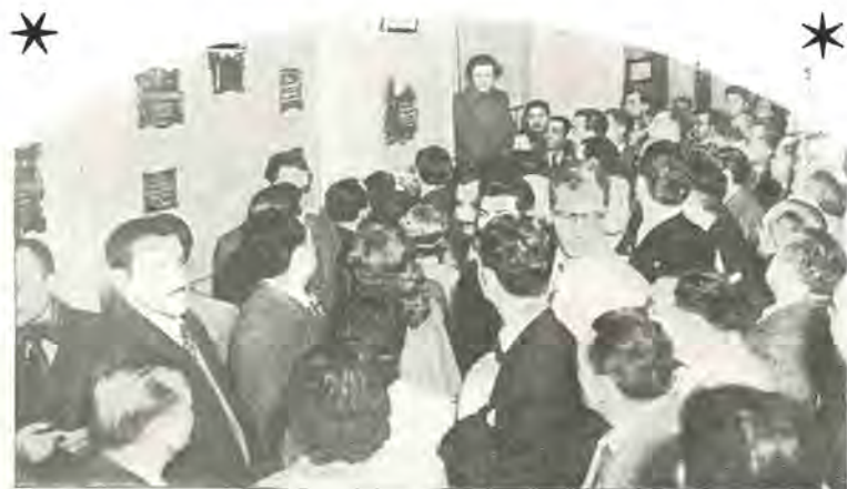
PLACAS RECORDATORIAS. — Otro aspecto de la ceremonia, pudiendo apreciarse en éste las placas recordatorias colocadas por diversas comisiones internas de la Federación Gráfica Argentina y que traducen sentidos homenajes al Libertador.

Los compañeros de "Noticias Gráficas" adhirieron así a los actos que en este Año Sanmartiniano se realizan en todo el país para honrar la memoria del Gran Capitán de los Andes en el centenario de su paso a la inmortalidad.