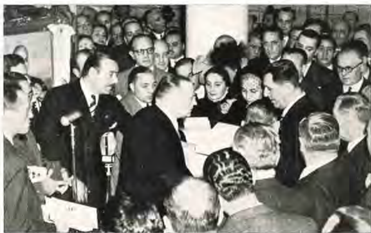
SALON "17 DE OCTUBRE". — El presidente de la República, general Perón, y su señora esposa, Eva Perón, durante la ceremonia inaugural del Salón "17 de Octubre", habilitado en el local de la Subsecretaría de Informaciones. Se hallan también presentes el titular de la misma, señor Raúl A. Apold; el presidente de la Cámara de Diputados de la Nación, doctor Héctor J. Cámpora; el ministro de Hacienda, doctor Ramón A. Cereijo; el presidente del Consejo Superior Peronista, senador Alberto Teisairé y otras calificadas personalidades.

Posteriormente, el Presidente de la República dirigió un mensaje a los trabajadores del campo, que fué radiodifundido por L.R.A. Radio del Estado y la red argentina de