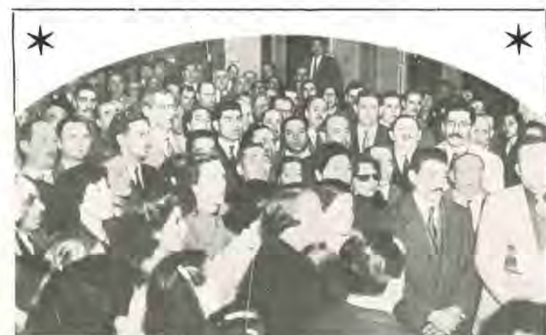
NUMEROSO PUBLICO. — Parte del numeroso público que concurrió a la ceremonia realizada en nuestra sede para honrar la memoria del Padre de la Patria, en ocasión de cumplirse el centenario de su entrada en la inmortalidad.

Este capítulo de la historia argentina, narrado tan suscitadamente, explica perfectamente por qué se ha dado en llamar al 17 de Octubre el Día de la Lealtad. Lealtad del pueblo con el hombre que supo interpretar sus inquietudes y dar vuelta al país como a una media para hacerlo socialmente justo, políticamente soberano y económicamente libre.