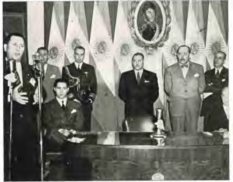
INSTITUTO SANMARTINIANO. — El jefe de Estado, general Juan Perón, haciendo uso de la palabra durante la ceremonia en que pusiera en posesión de sus cargos a los nuevos miembros directivos del Instituto Sanmartiniano.