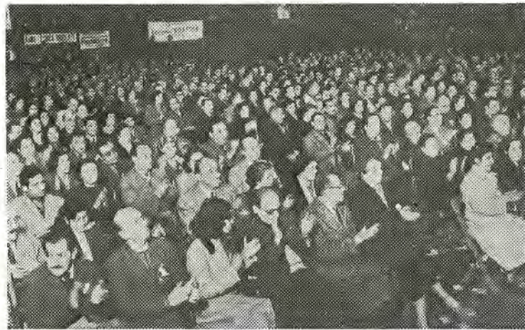
Otro aspecto de la asamblea realizada en el Luna Park: La instantánea fué tomada en momentos en que el público celebra con grandes aplausos el anuncio de las diversas e importantes mejoras.