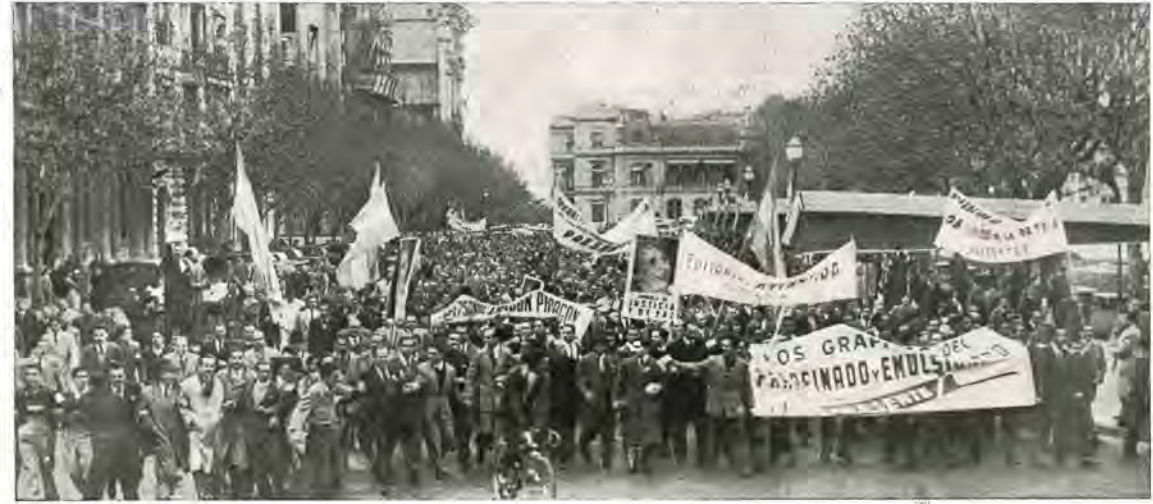
Cabeza de la columna de manifestantes, todos obreros gráficos, encaminándose desde el Luna Park hasta el Ministerio de Trabajo y Previsión. Portando carteles alusivos y grandes fotografías de la señora de Perón, los trabajadores de la imprenta pasan por la Plaza de Mayo en el más completo orden, pero animados de desbordante júbilo.

mos logrado llene ampliamente su cometido.