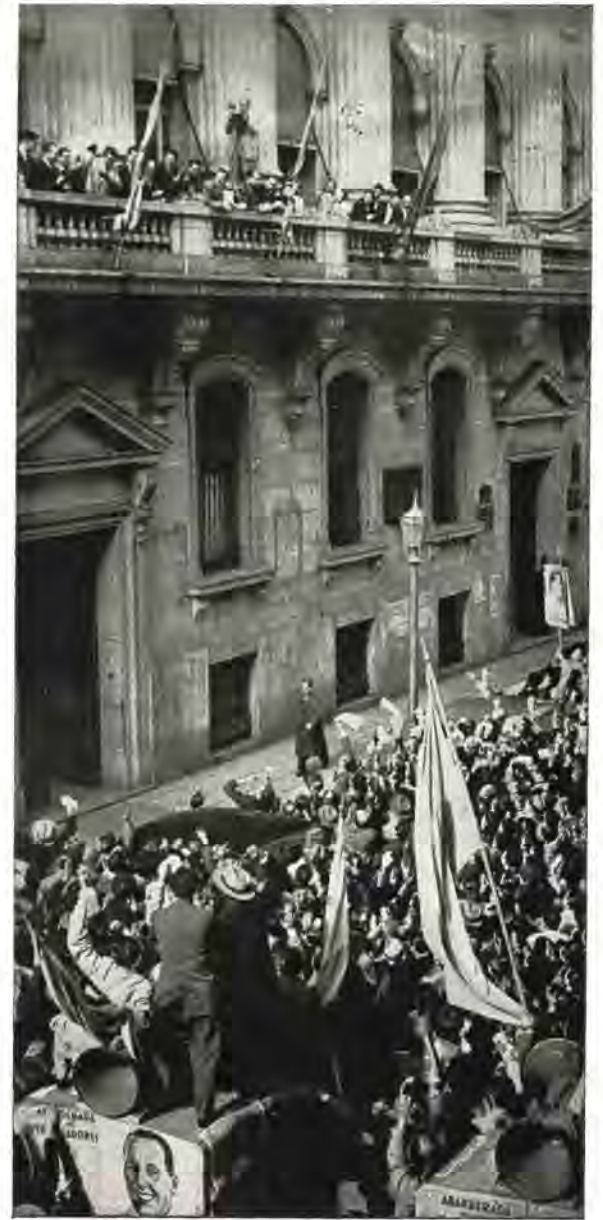
Otro aspecto de la concurrencia congregada frente a los balcones del Ministerio de Trabajo y Previsión, durante la manifestación realizada por los obreros gráficos para agradecer a la señora Eva Perón la aprobación del Convenio Justicialista.