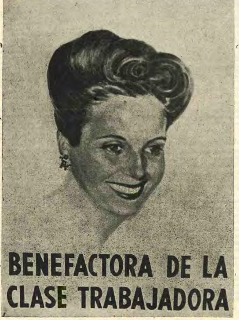
La esposa del Presidente de la República y abnegada colaboradora del Líder de las clases trabajadoras.

pueblo. Y esto ocurre con nuestro querido Líder que trabaja incansablemente por todos, aun por aquellos que lo combaten sin comprender que sus ataques, al dirigirse al general Perón, van dirigidos al corazón mismo del pueblo. El año transcurrido, mis queridos descamisados, ha sido de lucha. De lucha intensa y permanente. Ya conocen hasta donde debimos afrontar los desmanes de una oposición entregada a intereses foráneos. Pero no importa. Ya saben los descamisados que la bandera peronista no será jamás arriada. Los cientos de miles de corazones que hoy palpitan en esta plaza histórica, constituyen el símbolo de la lealtad. Por eso, con ese nombre, se ha denominado el 17 de Octubre "Día de la Lealtad", porque encarna la lealtad de un pueblo para con su vida, día de la lealtad entre hermanos de una misma causa que marchan seguros de su fuerza y de su destino.