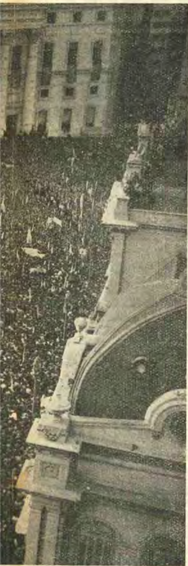
Es el pueblo que acudió con su inquebrantable lealtad a...

En sólo tres años hemos comprado por un valor de más de diez mil millones de pesos, lo que no sólo hemos pagado al contado, sino que de país deudor que éramos hemos pasado a ser uno de los únicos acreedores del mundo.