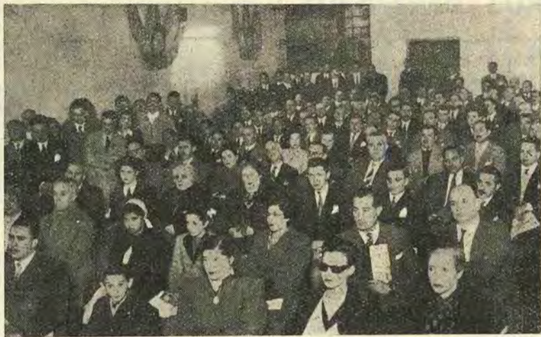
Auditorio. Vista parcial del público que escuchó la conferencia del exquisito poeta y escritor Homero Manzi, que a través de una charla jugosa y amena, explicó muchos sentidos del arte popular. El auditorio, compuesto por gráficos y sus familiares, premió con prolongadas salvas de aplausos al disertante y lo hizo objeto al finalizar su labor de una ovación y expresivas felicitaciones.

Comenzó el conferenciante por referirse al arte de la vieja España, el arte secular tapizado por los siglos, que llega un día a América y experimenta una evolución propia de su trasplante. En lo que con