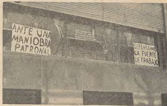
TOMA: Frente del edificio ocupado por los obreros que con alto espíritu de lucha vivieron una jornada magnífica en defensa de su fuente de trabajo que peligraba ante el cierre de "Crítica".

Las negociaciones habían entrado en punto muerto, y los representantes obreros interpretando el verdadero alcance de esa resolución, consideraron indispensable producir acciones de tipo sindical, susceptibles de hacer comprender que los trabajadores estaban dispuestos a llevar las acciones hasta sus últi-