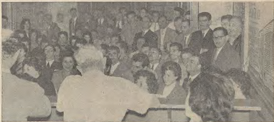
DECIDIDOS: Aspecto de la asamblea del personal de Anthony Blanck, que resolvió varias cuestiones que hacen a su mejor organización sindical, de las que da cuenta la presente crónica.

La presente nota gráfica muestra un aspecto parcial de la asamblea donde se destacó la conveniencia de rodear a nuestra Organización para que la defeción en que se incurrió no vuelva a repetirse; también se puso de relieve en forma entusiasta el apoyo que debe prestarse a las decisiones que adopte la Comisión Interna.