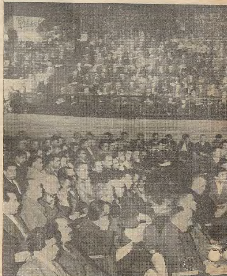
ASAMBLEISTAS: Vista de un sector de la asamblea en las gestiones que culminaron con la co

Taufalo: No quiere hacer críticas, pues el petitorio fue labrado por las