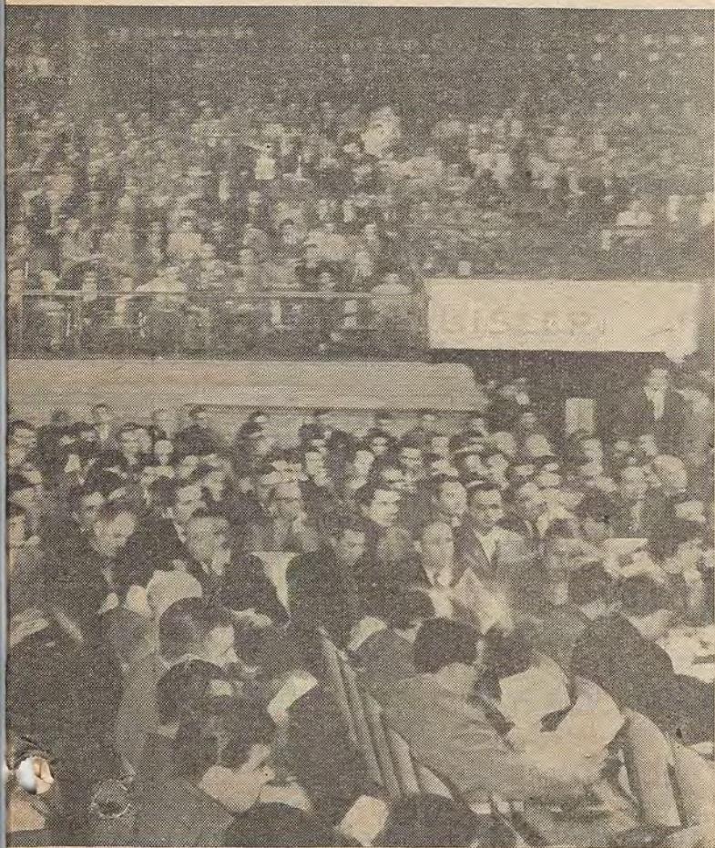
efectuado en el estadio Luna Park, donde se consideraron ampliamente concertación del nuevo Convenio para los gráficos de todo el país.