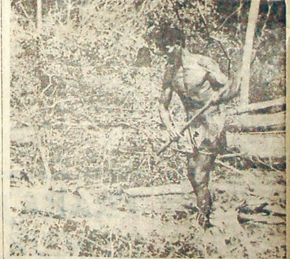
En nuestro número anterior denunciábamos la existencia de un campo de concentración de indígenas en Salta. Como este anuncio provocó dudas y asombro, publicamos hoy la evidencia documental obtenida por un compañero periodista en el ingenio San Martín del Tabacal. Los pequeños indios de la foto trabajan de sol a sol por 110 pesos diarios, las mujeres ganan 250. Tienen sólo un descanso de una hora y comen una vez por día.