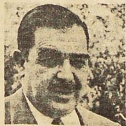
Gobernador Laborda Ibarra: las encíclicas mal leídas

"Como podrá ver Vuestra Excelencia fácilmente —expresa el obispo Caferra— se perciben en todo este proceso graves deficiencias con respecto a la verdad, a la sinceridad y a la justicia. Por eso me pregunto ¿cómo serán resguardados los derechos de los obreros, hoy casi inde-