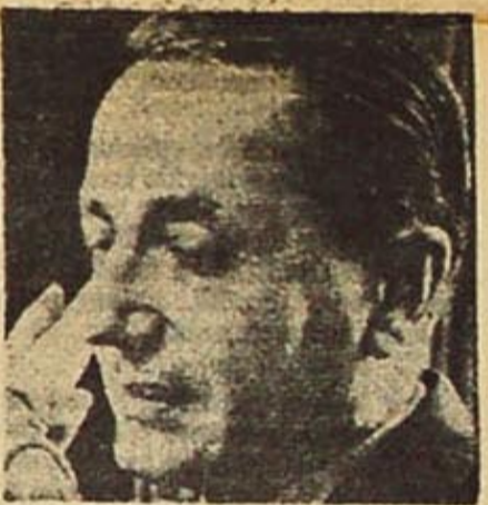
Borda: la ley de desalojos en acción

Luego de declarar la igualdad en la aplicación de la ley, dispone el juez hacer lugar a la demanda anticipada, declarando excluida del beneficio de la prórroga legal determinada por el artículo 2º inc. a) de la ley 16.739, a la presente locación a partir del 30 de junio del año en curso, y en consecuencia condena al demandado a desocupar el local Uruguay 556, dentro del plazo de 10 días a contar del 1º de julio, bajo apercibimiento de procederse al lanzamiento con el pago de costas correspondiente". (Diario "La Razón", 10/5/68.)