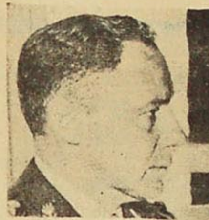
Presidente Oronzio o General Alsogaray: el sombrero y la gorra