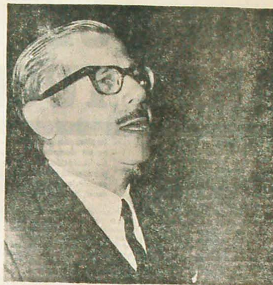
Krieger Vasena monumento al testaferro internacional, ideólogo de las fuerzas de ocupación.

Existe, además, un conjunto de empresas donde Krieger Vasena ocupa sillón de director, y que pertenecen o pertenecieron a la familia Llauro, que es la de su esposa.