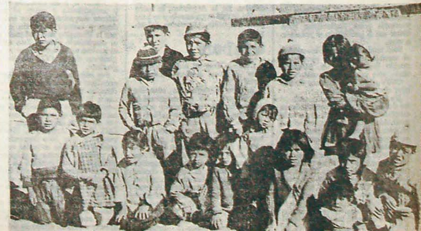
Ellos saben que sacerdotes están con el pueblo

—dice— a los compañeros. No pretendemos lograr un paro cuando el sindicato no respaldaría la acción de sus afiliados. Entendemos, si que debemos prepararnos para sumarnos a la lucha, y que ello la logremos cuando demos un cambio a la situación de nuestro sindicato. No queremos la intervención oficial, queremos que nuestra entidad ocupe un puesto junto a las organizaciones hermanas, en esta lucha por un aumento de salarios justo, por la reivindicación de las conquistas avasalladas y por la defensa del patrimonio nacional, que día a día está siendo enajenado al capital extranjero."