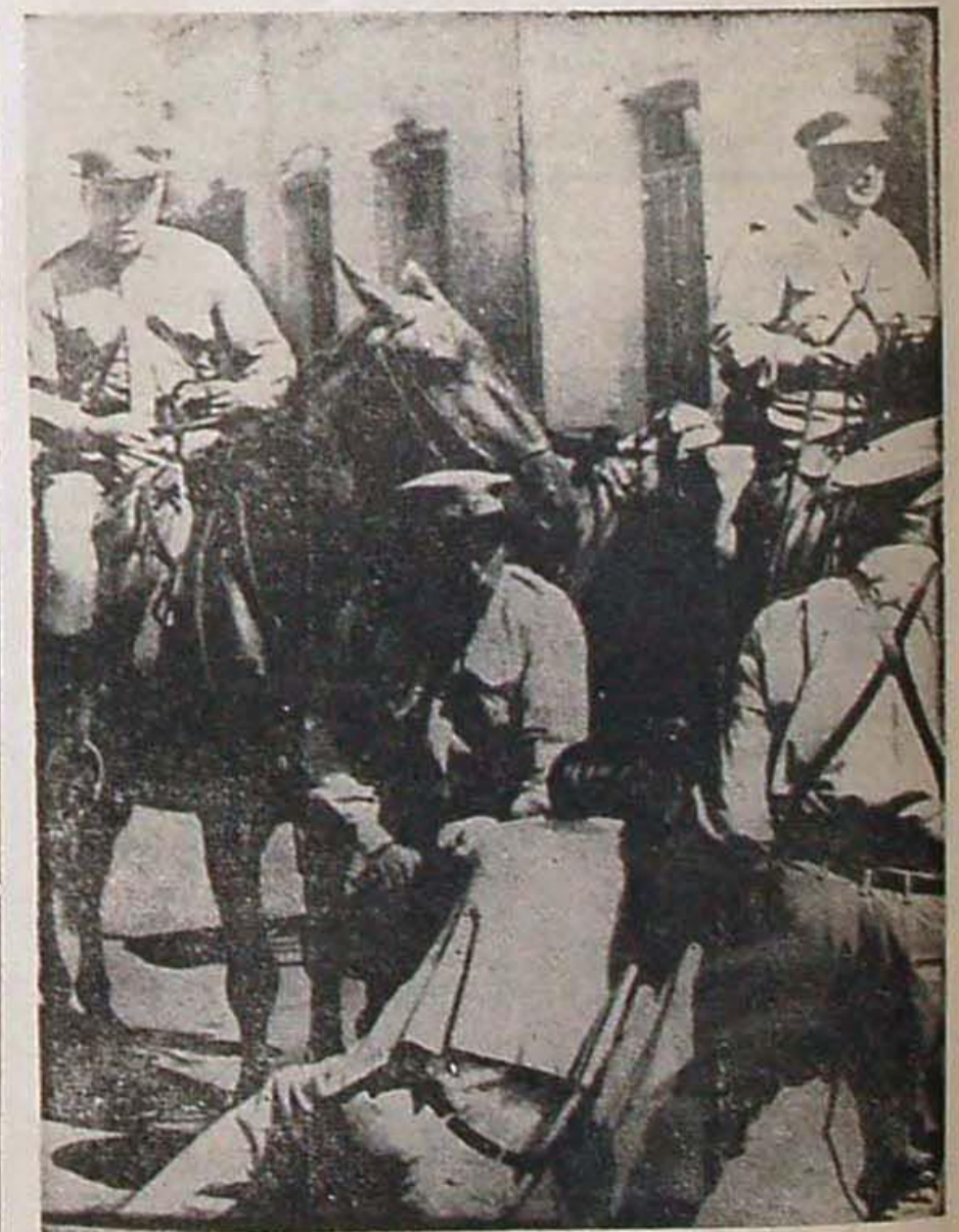
La policía de Tucumán apalea a sus hermanos por 30.000 pesos mensuales