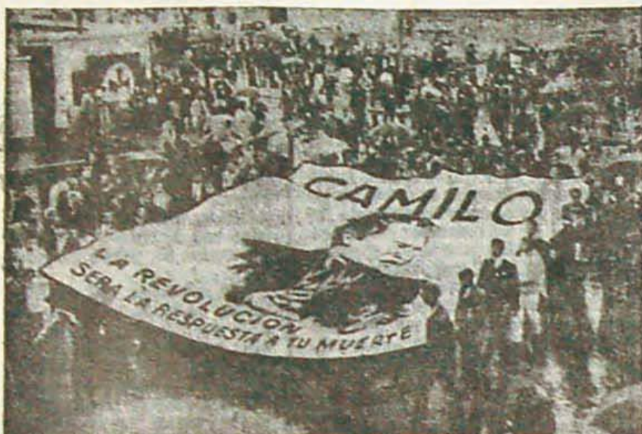
Camilo Torres: murió en la guerrilla para liberar América Latina.

La situación de explotación y miseria que sufre el pueblo en las distintas regiones de América Latina ha hecho que numerosos sacerdotes católicos que viven en contacto con ese pueblo y que sufren igual porque son parte de él, reaccionen en contra de esas injusticias. El ejemplo más conocido de los últimos tiempos es Camilo Torres, que abandonó sus hábitos (aunque no su condición de sacerdote) y marchó a la guerrilla, donde dejó su vida.