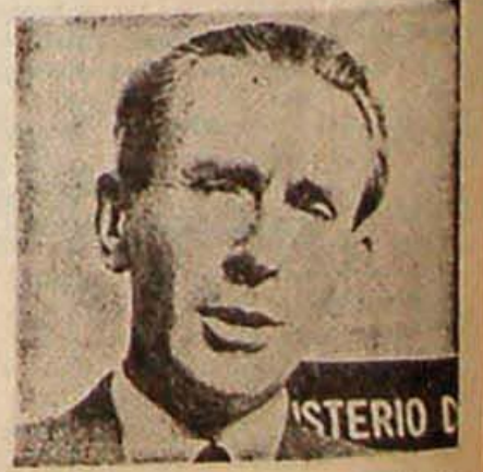
Dos épocas, dos visiones diferentes del papel de las Fuerzas Armadas en el desarrollo nacional.