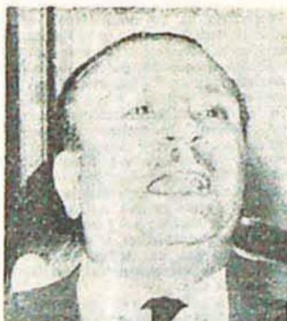
Scipione: un programa de acción.

Para cohesionar al gremio en esta lucha, DIRECTIVA Y COORDINADORA CENTRAL convocarán próximamente un Plenario de Delegados del Gran Buenos Aires y otro NACIONAL al que desde ya invitamos a concurrir con noticias sobre estas tareas, las cuales —nos es grato informar— ya han comenzado a aplicar seccionales del gran Buenos Aires y del interior.