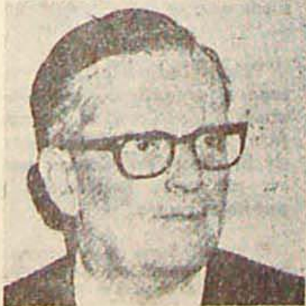
Caballero: le descubren los planes.

El despido de Uzal debería servir de toque de atención al Sindicato Argentino de Televisión y a los trabajadores de la rama, porque ese hecho no es sino la manifestación concreta más reciente de los frecuentes atropellos que se cometen en los canales de televisión, generalmente con la complicidad de cierta prensa comercial que se encarga de deformar los hechos.