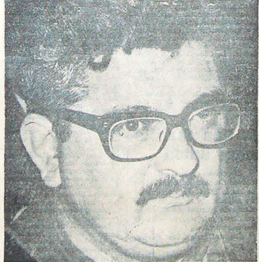
Ortiz (San Martín), FATRE traiciona.