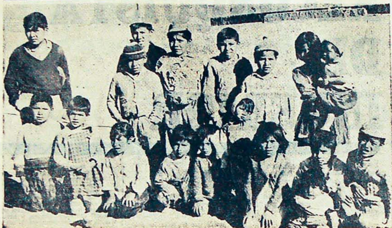
Niños jujeños: todos tenemos una deuda con ellos.