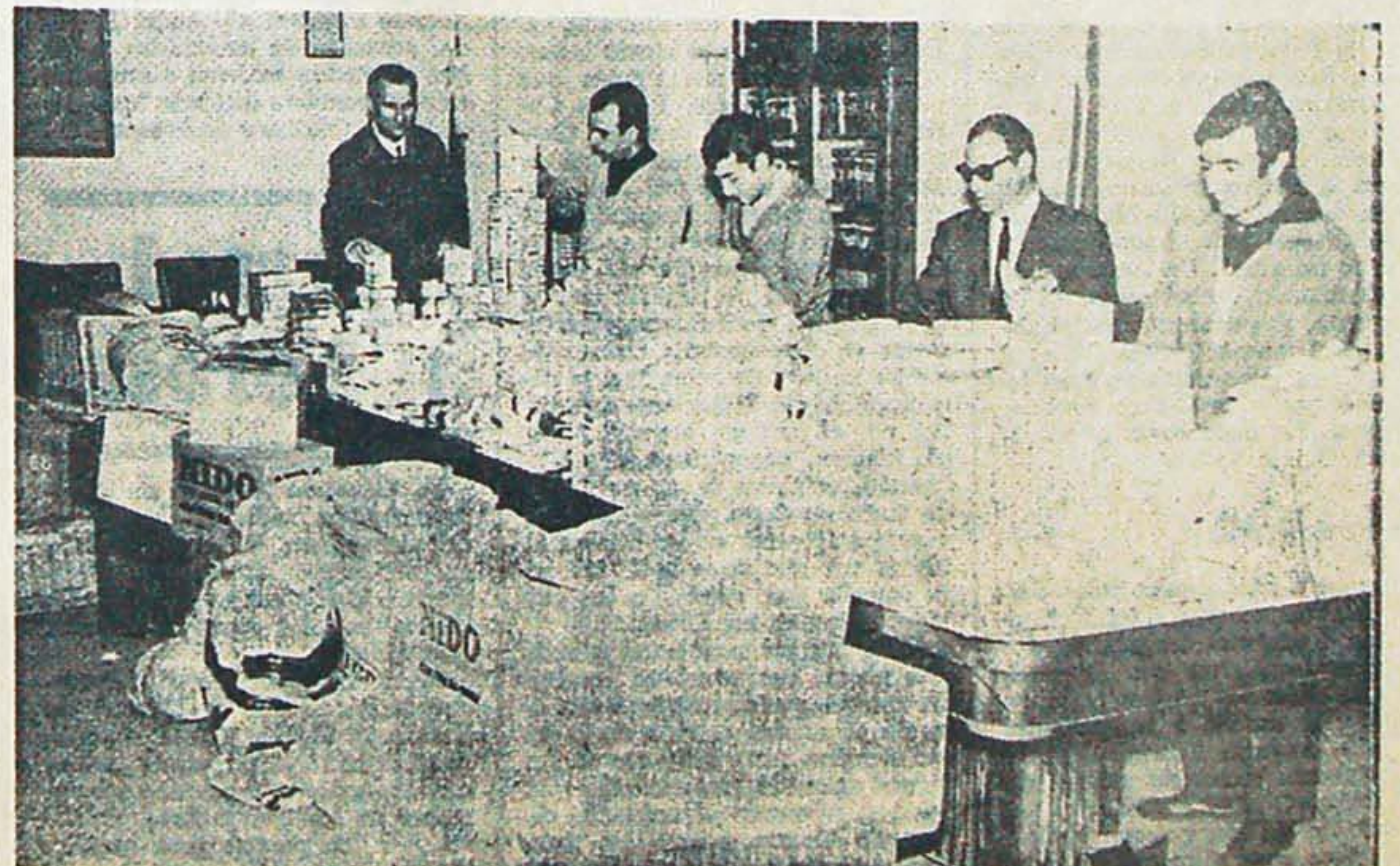
El Sindicato Standard Electric de FOETRA se une a la campaña de ayuda a Tucumán con un importante envío de alimentos.

5º) Solicitar al Secretario General de las Naciones Unidas, Sr. U Thant, se adopten con urgencia las medidas conducentes al retiro de las tropas invasoras, y a impedir cualquier clase de atropellos por las mismas.