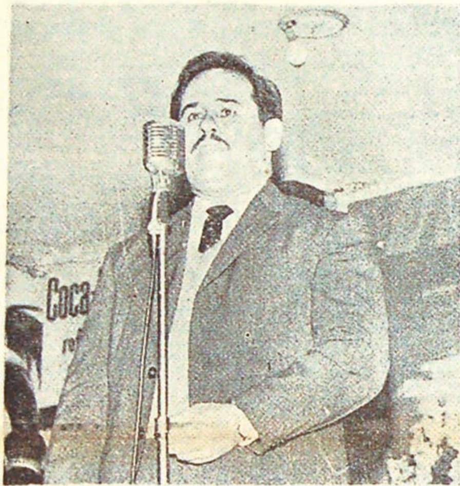
Correa: la unidad existe en la calle y en la lucha.

La provincia de Córdoba resultó el terreno elegido para que el gobierno de Onganía ensayara sus ideas comunitarias, que sus enemigos liberales llaman fascistas. La aparición de la efigie del gobernador Caballero en la tapa del semanario oficialista "CONFIRMADO" indicó a los entendidos que el operativo estaba en marcha. El propio semanario indicó sin embargo las dificultades de la empresa: para integrar los famosos consejos asesores hacen falta trabajadores dispuestos a colaborar con el gobierno. Y eso es lo imposible de encontrar en Córdoba.