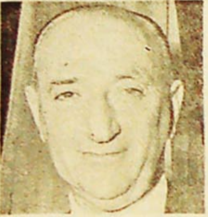
Almirante Castro (CONADE)

Los hilos que en aquellos años se enredaron, ya nunca más volverían a separarse. Una compleja madeja de intereses y complicaciones se ha ceñido cada vez más, y hoy puede hablarse sin exagerar de que con ellos se pretende estrangular al mismo tiempo a la marina mercante y a la compañía de aviación nacional.