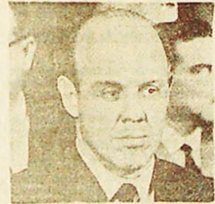
Canciller Costa Méndez