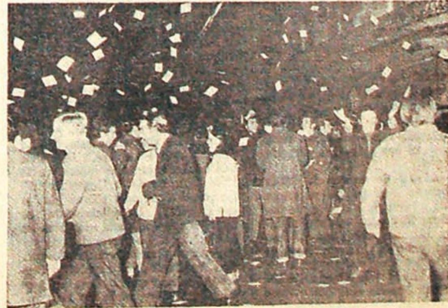
En La Plata, los estudiantes ganaron la calle. Hubo policías que se negaron a reprimir.

Mientras esto sucede, el gobierno (Continúa en la pág. 6).