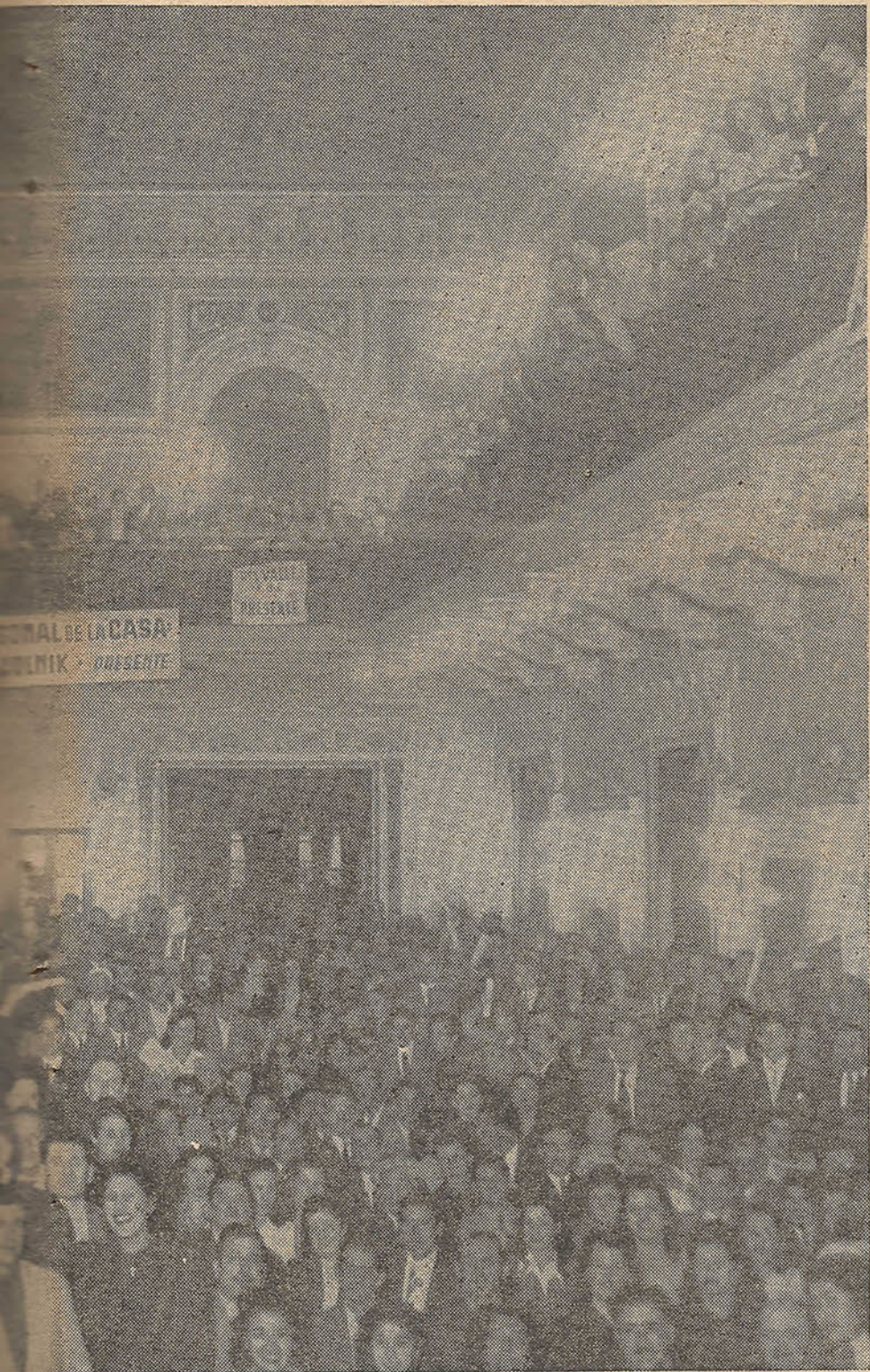
firmar su decisión de no aceptar la propuesta patronal.

PRESIDENTE (J. C. Lontrato). — PONE A VOTACION LA PROPOSICION DE LA C. G. A. LA QUE ES APROBADA POR UNANIMIDAD.