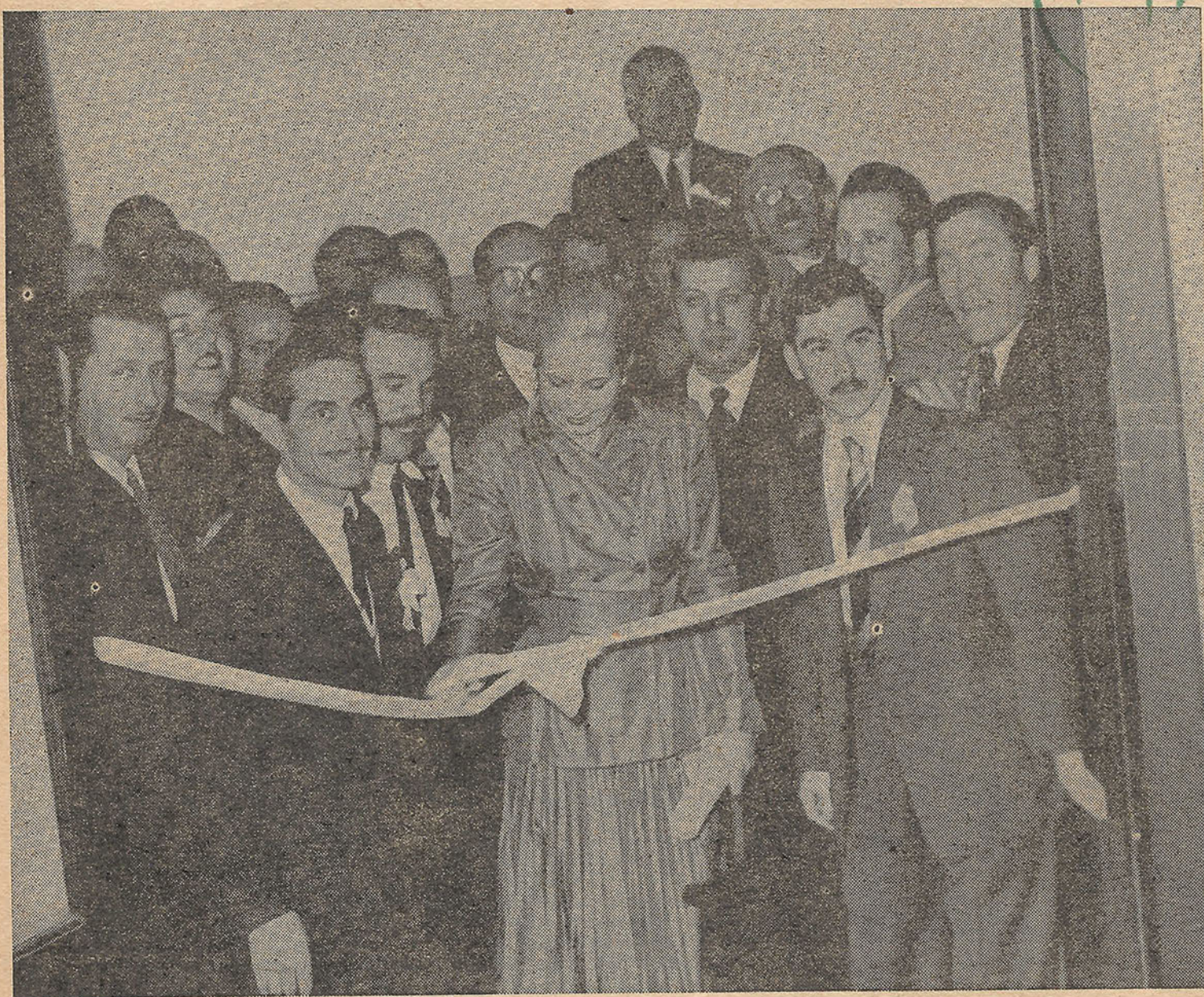
Momento en que la Primera Dama corta la cinta simbólica.