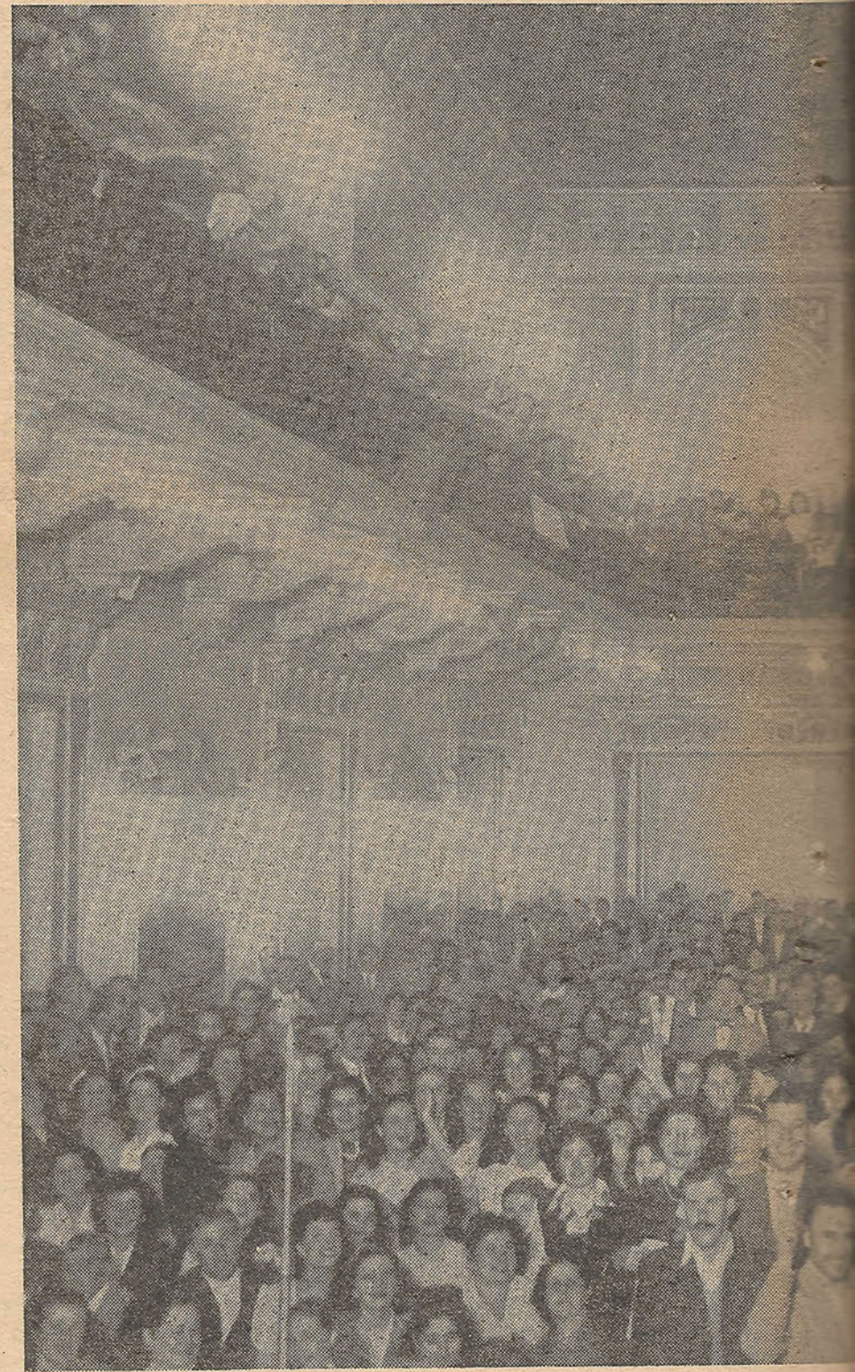
En su segunda asamblea la Rama Cartonera volvió

A esto se debe haber anticipado en asamblea. Pedimos a todos los compañeros que después de haber leído en asamblea la proposición de la C. G. A. no se dejen embaucar por ningún industrial cartonero, que no tengan en cuenta ninguna de sus palabras cuando manifiesten a los compañeros que hay aumento de X centavos, pues el aumento que registrará será el que tratará la C. G. A. y la asamblea del gremio y único que deberán tener en cuenta los compañeros como así las directivas que emanan de esas fuentes. No se dejen engañar los compañeros por las maniobras que han pretendido los señores industriales poner en juego en esta oportunidad. No sería nada diferente en estos días vinieran los señores industriales, viendo el fracaso de la maniobra anterior, con una nueva ten-