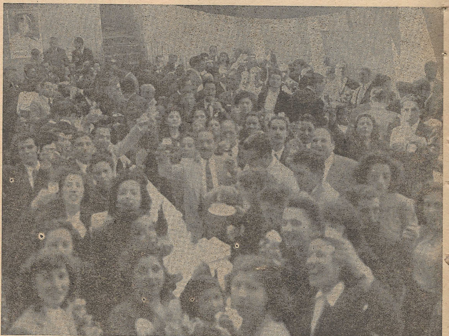
Franca y sana camaradería entre los compañeros dió motivo este acto trascendental en la vida de nuestra organización.