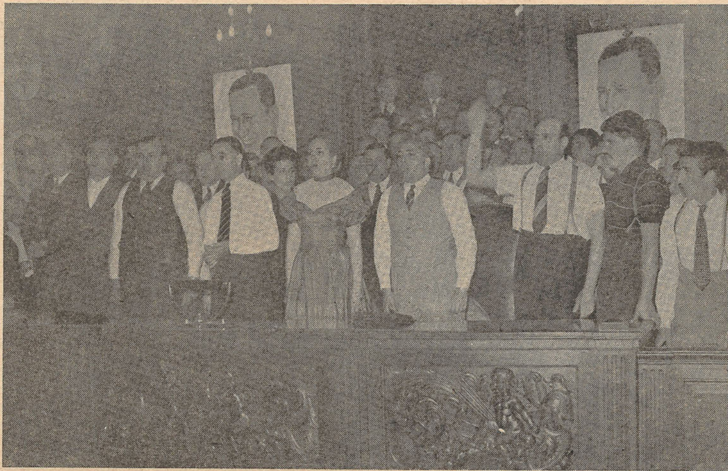
EN MOMENTOS DE ENTONARSE LAS ESTROFAS DEL HIMNO NACIONAL. LA ESPOSA DEL Primer Mandatario que asistió al acto, agradeció el homenaje tributado por los gráficos argentinos.

Lamento mucho pero debo dejarlos; los descamisados de Burzaco me están esperando. Hasta luego y les dejo todo mi corazón".