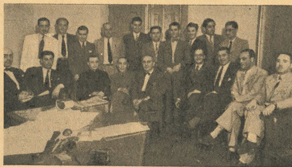
REPRESENTANTES de la Sociedad Artes Gráficas, Sociedad de Industriales Gráficos de Santa Fe, secretario de la F. A. T. I. y director regional del Departamento P. del Trabajo, después de firmar el convenio.

Sobre todo, deben tener en cuenta los compañeros santafesinos el valor moral que tiene el convenio concertado y estar convencidos que su respeto por parte de los industriales reside más que en su buena fe, en la unión del gremio. Deben, pues, nutrir a su sindicato con su energía, con su entusiasmo, con su disciplina, y sólo de esta manera el magnífico instrumento conquistado tendrá un valor efectivo.