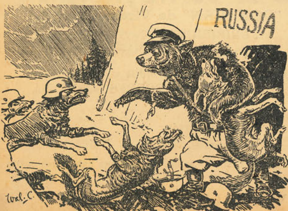
Los lobos en apuros