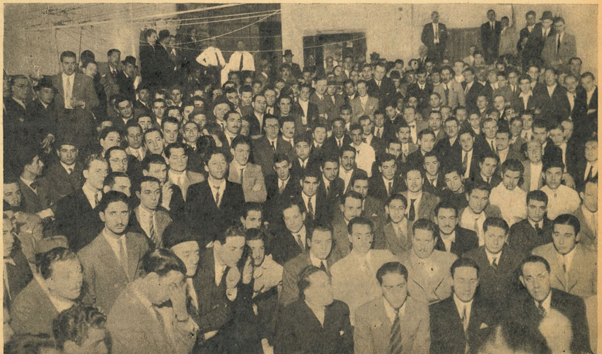
UNA PARTE DE LA EXTRAORDINARIA concurrencia que asistió a la primera asamblea de huelga del fotograbado realizada el 10 del corriente.