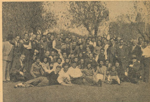
NUCLEO DE COMPARERAS Y COMPAÑEROS asistentes a la fiesta campestre de La Plata.

Luego, en una magnífica quinta, vecina a la estación del ferrocarril Meridiano V, tuvo lugar el almuerzo campestre con que obsequiara a