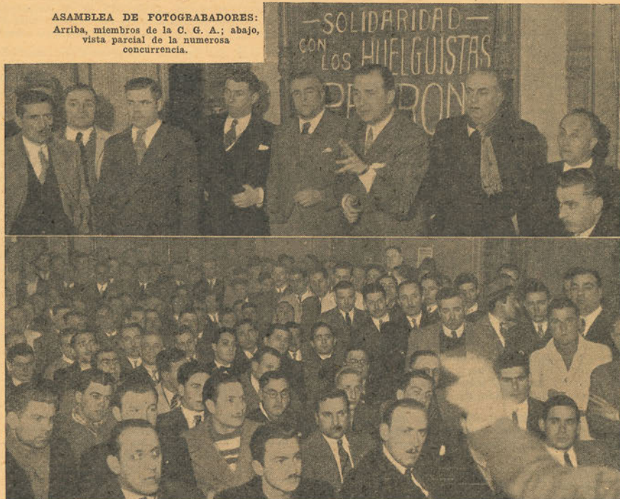
ASAMBLEA DE FOTOGRAFADORES: Arriba, miembros de la C. G. A.; abajo, vista parcial de la numerosa concurrencia.