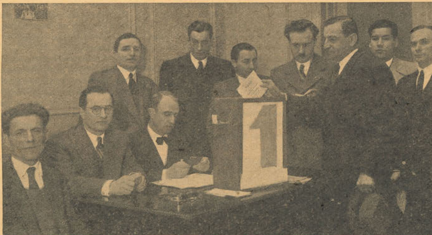
En plena tarea eleccionaria. Mesa receptora de votos. Un compañero depositando su voto.