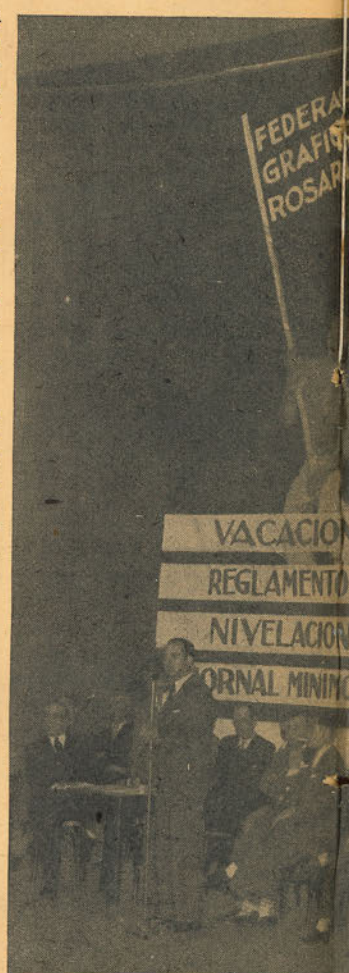
MIEMBROS DE LA C. G. A. DE LA FEDERACION GRAFICA ROSARINA y de talleres. Al fondo, cuadro de la organizacion.